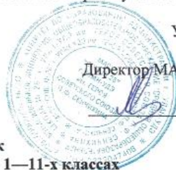
График оценочных процедур в 1—11-х классах на первое полугодие 2023-2024 учебного года